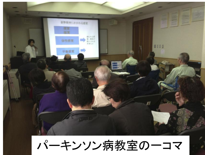
パーキンソン病教室の一コマ