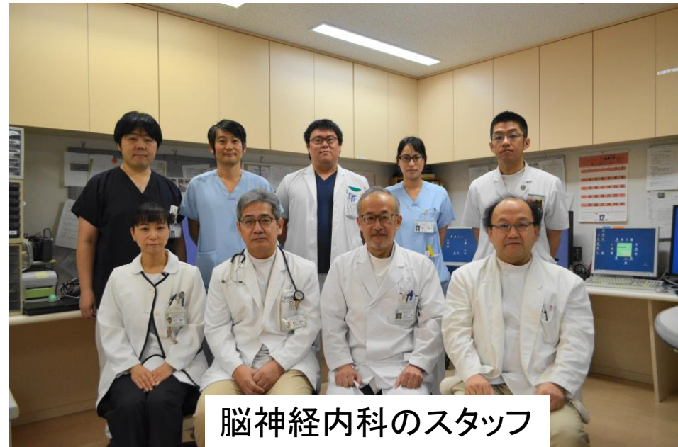
脳神経内科のスタッフ