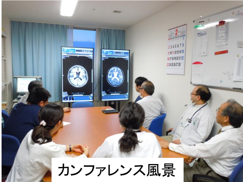
カンファレンス風景