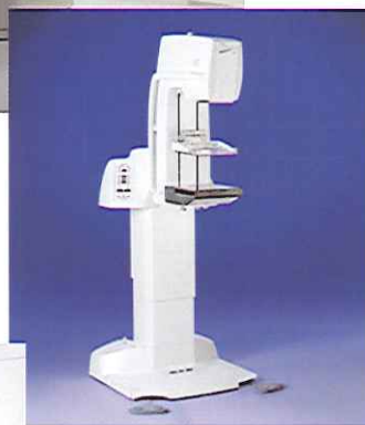
乳房エックス線装置