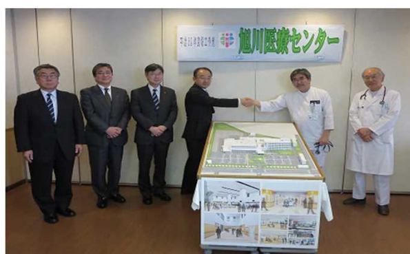
完成模型図をはさみ請負業者4社と院長、副院長

工事期間中は当院利用の皆様、近隣の皆様にもご迷惑をおかけしますが、何卒ご理解の程よろしくお願いいたします。