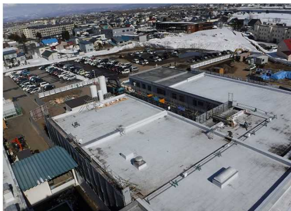
リハビリ棟(中央)の解体が始まりました