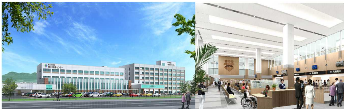
完成イメージ図(左側:新外来棟、右側:既存病棟)