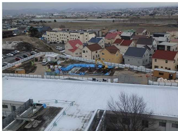
受水槽、液酸ポンプ棟(中央奥)の建設が始まりました