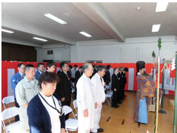
院内及び工事関係者による祈願